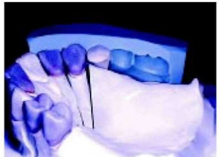
9. Конструкция охватывающей части...