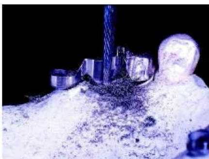
19—20. На зубную опору и охватывающий держатель наносится параллельное рифление в 0°.