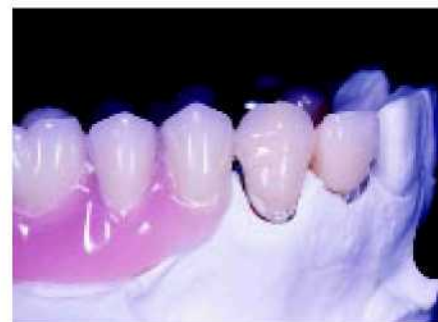
48. Переход между коронкой и съёмным протезом вообще едва ли виден.