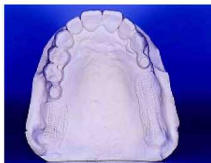
33. Модель из тугоплавкого материала представляет собой реалистичную реплику...