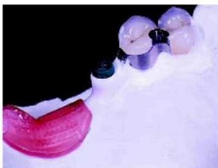
31. С помощью специального дублирующего макета создаётся необходимое пространство для применения техники наполнения (адгезивная техника).