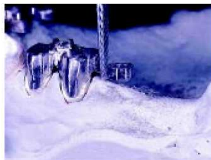
21. Из эстетических соображений, переход между коронкой и охватывающим держателем должен быть достаточно мал.