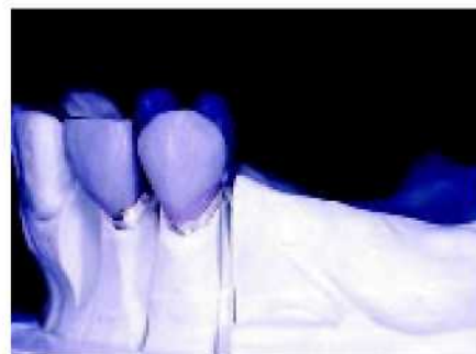
3. Положение точки контакта по отношению к десне в значительной степени определяет способ фиксации соединителя на коронке.