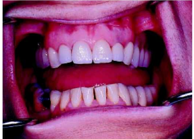
53. Гармония — вот результат правильно выбранных материалов, методов и опыта.