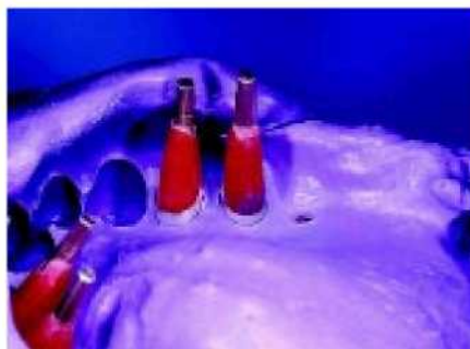
29. Матрица из акриловой смолы гарантирует пассивную фиксацию при дальнейшей обработке