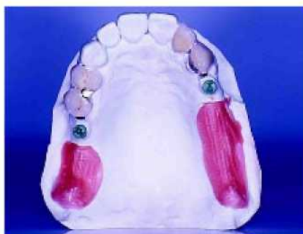
32. После высвобождения воска вокруг крепления остаётся приблизительно 1 мм свободного пространства. В дальнейшем это пространство между креплением и седлом зубного протеза заполняется металлом.