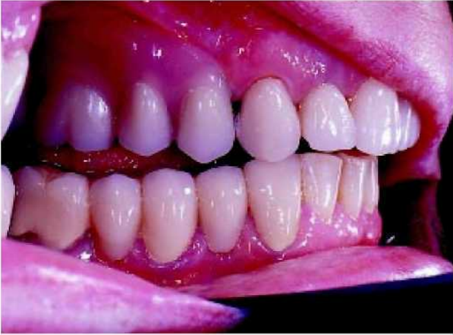
52. Точно подогнанные крепления в области перехода между фиксированной и съёмной частями протеза.