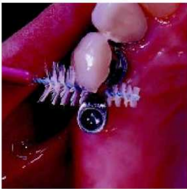
54. Возможности профилактики обеспечивают большой срок службы периодонтального окружения.