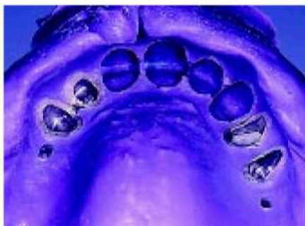
28. Охватывающее основание на просвет, видно его пассивное прилегание к десне.