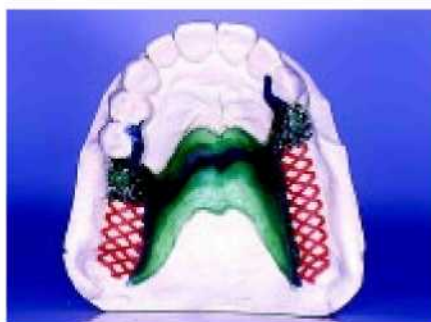
35—36. Металлическое основание обрабатывается воском традиционным способом с использованием нёба для частичной поддержки.