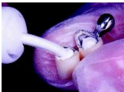
26—27. При приготовлении промежуточного оттиска, основные части фиксируются временным раствором, что позволяет избежать смещения (часто оно происходит, когда раствор ещё не затвердел).