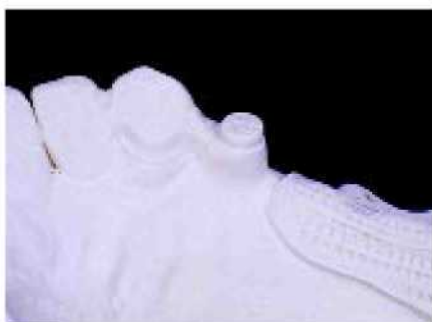
34. ... среди прочего видно крепление с дублирующим макетом.