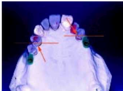
14. Снижение опоры на зубы необходимо в случае неровно помещённой опоры, чтобы избежать поперечного качания,