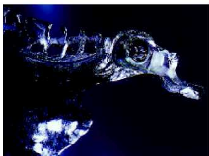
44. После отверждения композита, вставная часть становится в правильное положение.