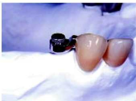
43. Прежде чем зафиксировать на протезе вставную часть, она помещается в охватывающую часть с промежуточным объёмным держателем.