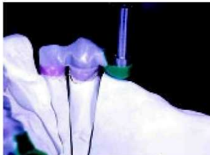
11—12. Строгая параллельность линия вставки без сомнения необходима, Рифлёные кромки (0°) выполняют функцию опоры на зубы.