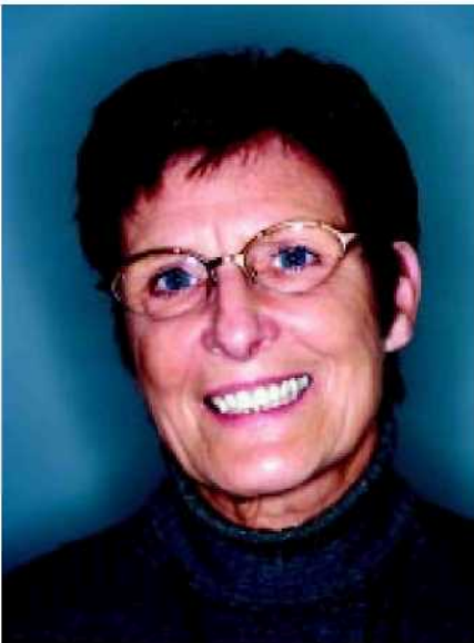
55—56. Съёмный протез с креплением СЕКА REVAX может восстановить зубную дугу в эстетическом и функциональном смысле к полному удовлетворению пациента.