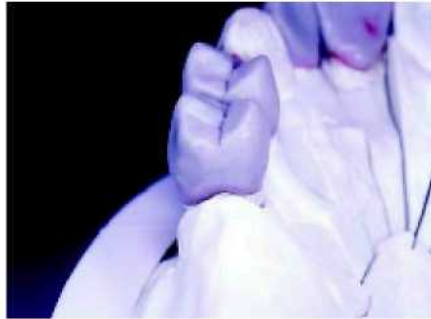
5—6. Центр альвеолярного гребня определяет горизонтальное положение фиксатора протеза (охватывающая часть),