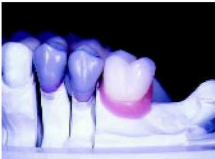
7—8. Расположение зубов является показанием для вертикального размещения с идеализированным восстановлением прикуса.