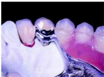
49—50. Рифлёная опора зубного протеза гарантирует аксиальную передачу механического напряжения.