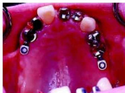
24. Металлическая основа с фарфоровой облицовкой примеряется на своём месте во р м у. Теперь можно произвести окончательное уточнение оттенка.