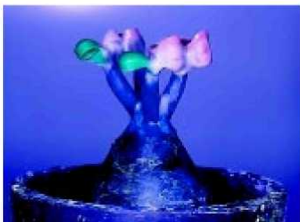
16. Наклонное расположение облегчает введение материала заливки.