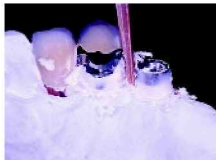
30. Произведена фиксация воском по д углом 2° с помощью нагретого штифта. Это придает устойчивость при изготовлении основы. Таким образом, достигается пассивная фиксация.