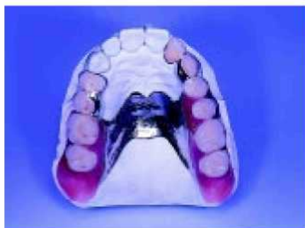
47. Бугристая часть челюсти всегда закрыта.