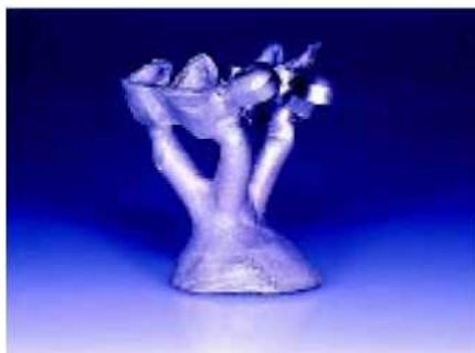
17—18. Для обеспечения лучшей адгезии композита (адгезивная технология), внутренняя поверхность охватывающего держателя также обрабатывается 110 мкм оксидом алюминия на пескоструйном аппарате.