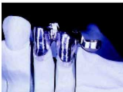
23. Охватывающий держатель помещается в центре оси первого протезного элемента, чтобы он не был виден из-под съёмного протеза.