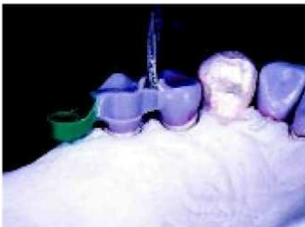
13. Окружающая на 180° опора на зубы может быть выполнена окклюзивным смещением, а не межзубным рифлением (которое может привести к ослаблению).