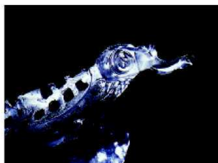
39. Чистота внутри гарантирует хорошее связывание,