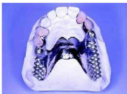
38. Готовая металлическая часть основания должна вставляться без всякого трения.