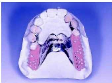
46. Сёдлам придаётся розовый оттенок.