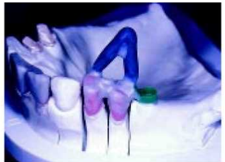
15. Каналы для литья размером приблизительно 3,5 мм подходят к каждой объёмной части,