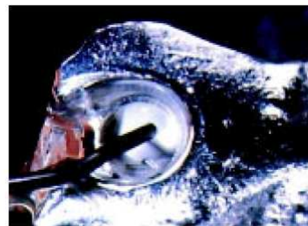
42. Полость, обработанная пескоструйным аппаратом (110 мкм), заполняется специальным анаэробным связывающим композитом CEKA SITE.