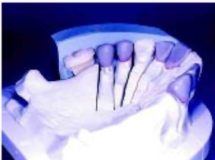
10. ...соответствует расположению зубов.