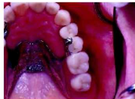
51. Для изменения глубины опоры протеза перемещается в направлении челюсти.