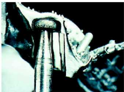
40—41. Для обработки внутренней поверхности используются принадлежности RE H 20 и RE H 10.