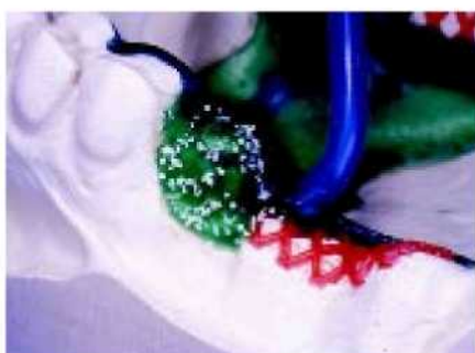
37. Правильное положение литников обеспечивает точное литьё.