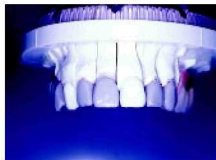
1—2. Реставрация анатомии как основа подструктуры и расположения присоединяющих элементов.