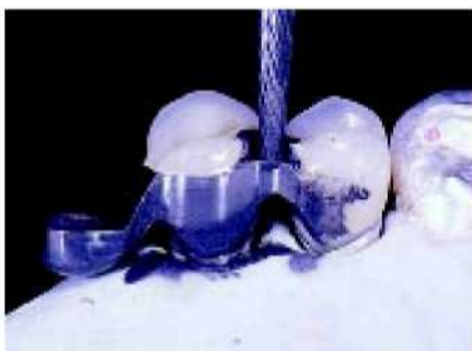
25. После обжига фарфора на коронке, переход метал/фарфор обрабатывается дополнительно.