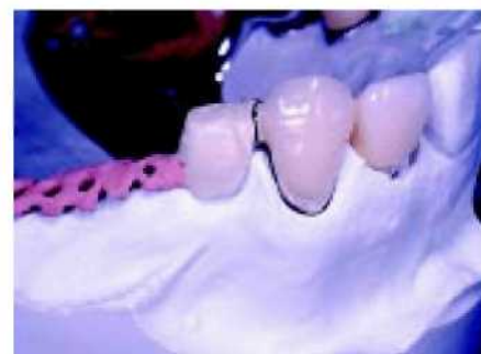
45. После доведения оттенка протезный элемент можно поместить на место,